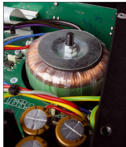
Endlich mal wieder: Eine richtige Stromversorgung tut jedem HiFi-Gerät gut – auch dem Rega-DAC