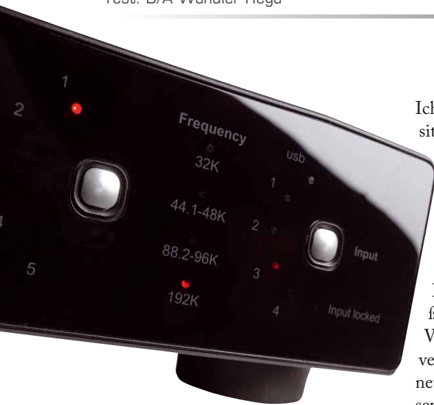
Ein LED-Indikator an der rechten Seite zeigt die „eingelockte“ Abtastfrequenz des Eingangssignals an, bis 192 kHz kann der Wandler verarbeiten

überlegt, dass das häufig verwendete Hochrechnen eines 44,1-kHz-Signals nicht selten aus klanglicher Sicht gar in die Hose geht, ist das, zumindest aus meiner Sicht, eine weise Entscheidung, auch wenn man dann nicht in hübschen großen Buchstaben „192 kHz Upsampling“ auf die Packung schreiben kann.