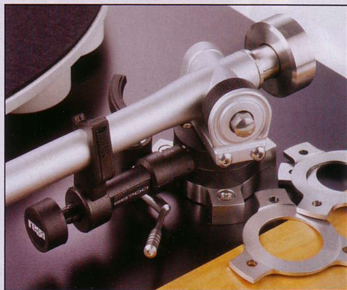
Zur Höhenverstellung des Arms RB-700 gibt's Edelstahl-Spacer (rechts). Das am Stück gegossene Armrohr entwickelte Rega 1980 für den RB-300

Technisch betrachtet, ist der P7 kein getunter P5, sondern eher ein etwas preisbewusster gebauter, klanglich nur geringfügig abfallender Verwandter des P9 (Test im Sonderheft AUDIOphile 3/99, 4500 Euro). Nach dem P7 braucht man also im Grunde keinen weiteren Spieler mehr.