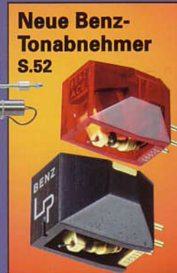
Neue Benz- Tonabnehmer S.52