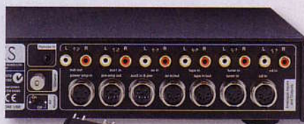
Durch das Entfernen der Steckbrücke werden beim Nait XS Vor- und Endstufe aufgetrennt

Im STEREO-Hörraum offenbaren beide Briten alsbald ganz eigene Charaktere. Indes: Überraschungen blieben aus, was absolut positiv zu verstehen ist! Wir kennen zum Bei-