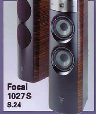
Focal 1027 S S.24