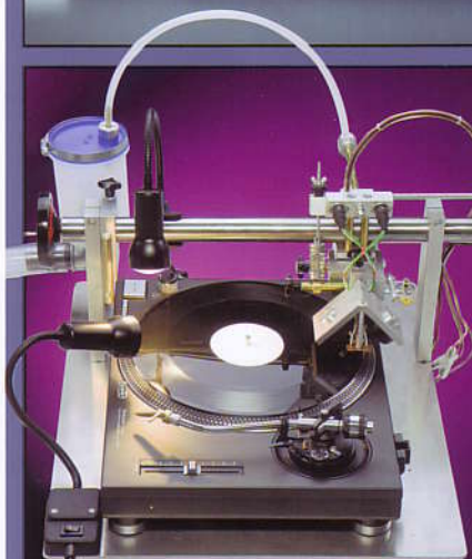
Hype oder Humbug? LPs selber schneiden S.26