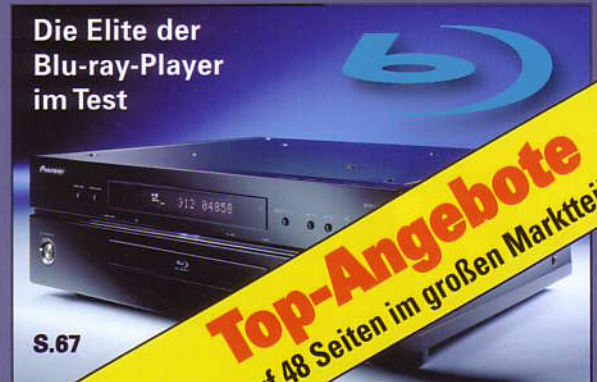
Die Elite der Blu-ray-Player im Test S.67

Top-Angebote auf 48 Seiten im großen Marktteil