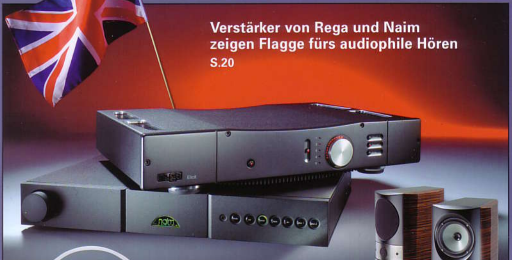
Verstärker von Rega und Naim zeigen Flagge fürs audiophile Hören S.20