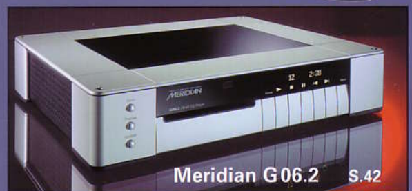
Meridian G06.2 S.42